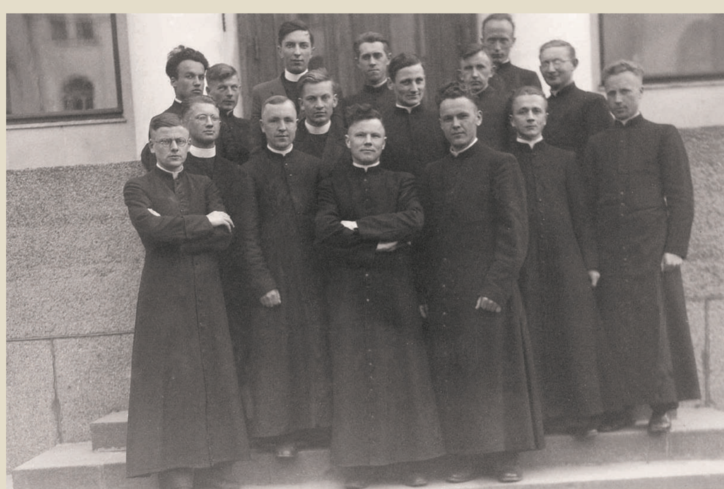
Kauno kunigų seminarijoje su studijų draugais