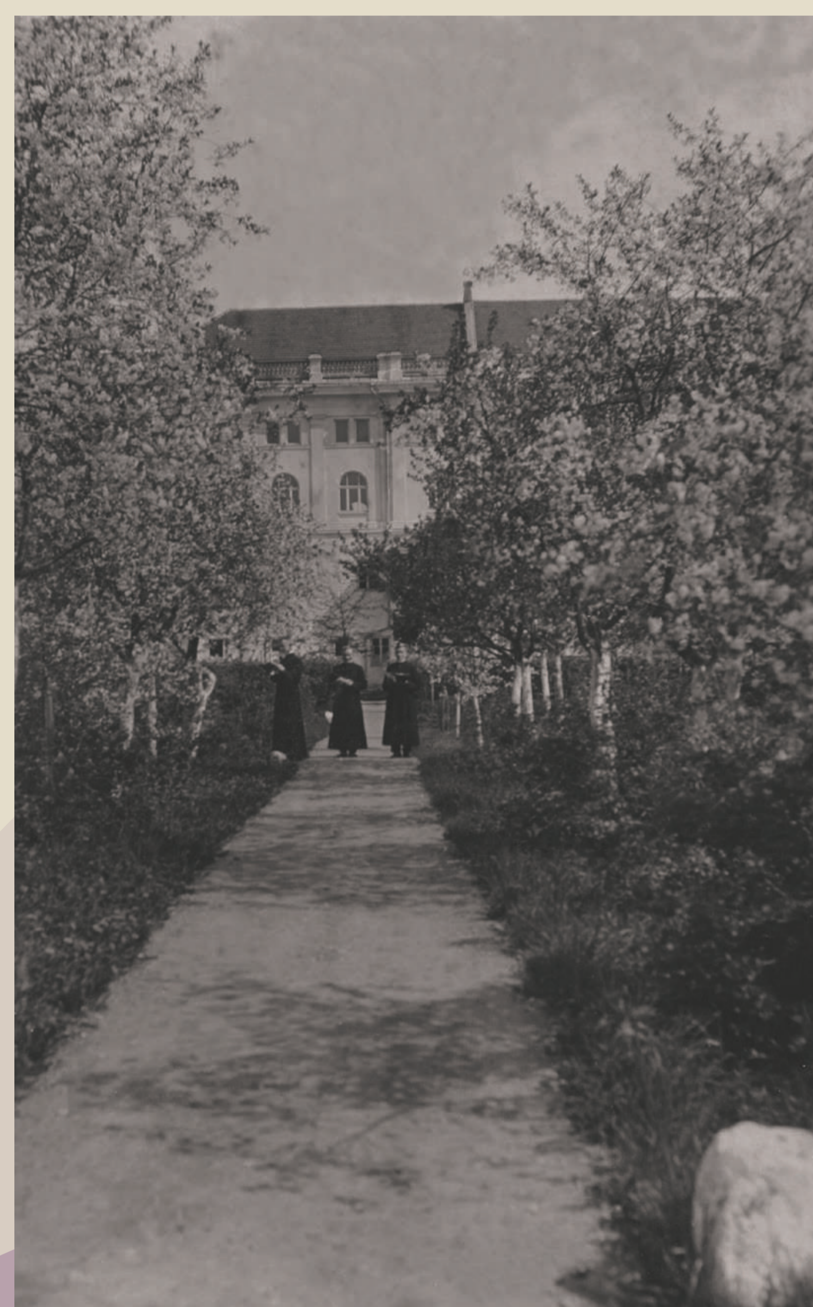
Kauno kunigų seminarija. XX a. 3-4 deš. Antano Buratinko ir Antano Viemolio-Zakausko memorialinis muziejus