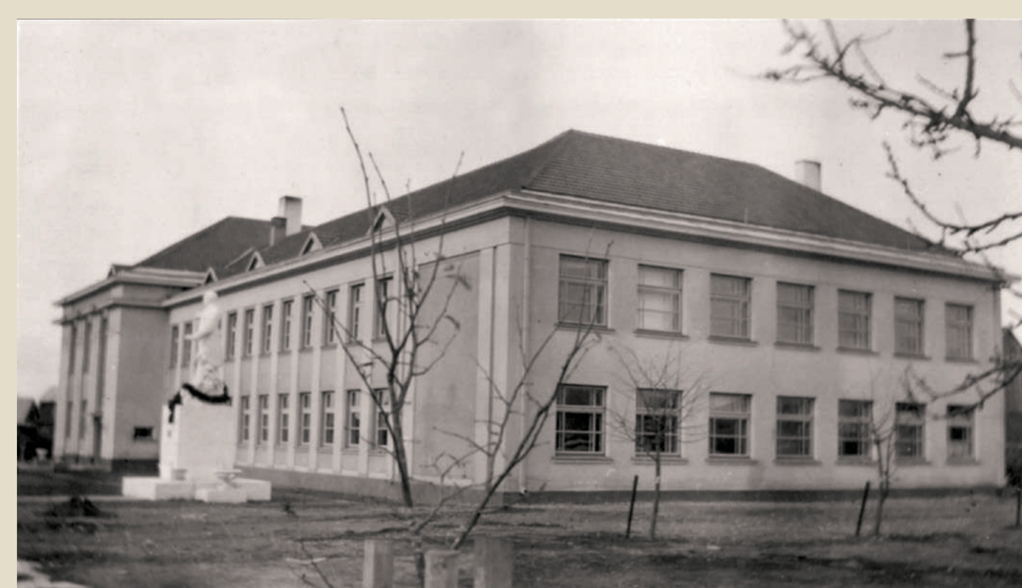
Pasvalio gimnazija. 1935

„Jis man vis pasakodavo apie savo Krinčiną, savo gimtinę. Man pasirodė, kad ji buvo jam labai svarbi. Net ir dainų dainuodavo apie Krinčiną... Išpasakodavo man visas savo tėviškės naujienas, pasakodavo, kad jis tiesiog miške gimęs, tarp miškų užaugęs.“