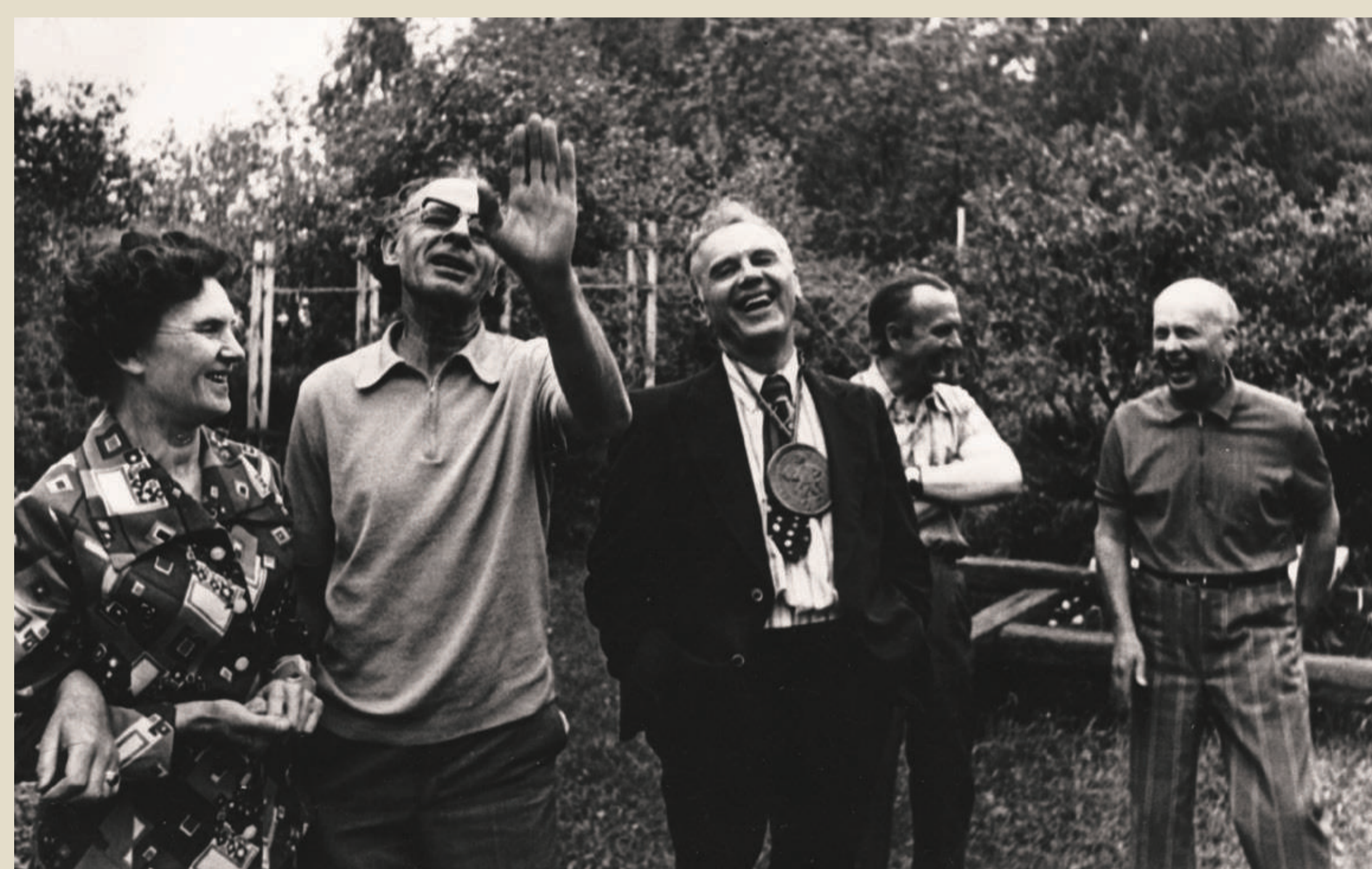
Pasvalio gimnazijos klasiokų susitikime